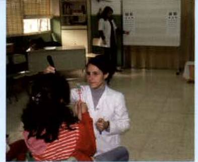
Los ópticos-optometristas realizan varias pruebas a los niños en el centro escolar.

de sus alumnos. El Colegio de Ópticos-Optometristas ha organizado las jornadas de Control Visión, que comenzaron el lunes y se prolongarán hasta el próximo 29 de enero en horario de mañana (10:00 a 14:00 horas). Seis diplomados en Óptica y Optometría y cuatro diplomados que realizan el Máster en Optometría Clínica, supervisados por cuatro profesionales de la Universidad de Murcia, son los encargados de llevar a cabo las distintas pruebas.