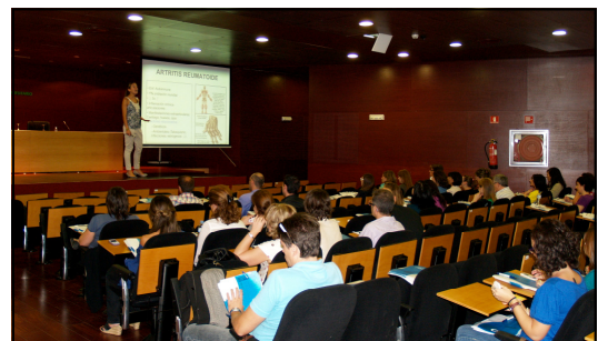
Salón de Actos del Hospital General Reina Sofía de Murcia

en su parte presencial en el Salón de Actos del Hospital General Universitario Reina Sofía, el 15 de octubre, con una novedosa plataforma de video interactivo como medio de enseñanza adicional.