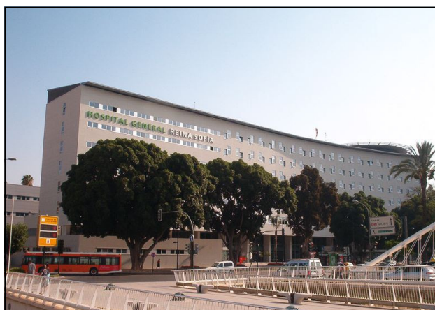
Hospital General Universitario Reina Sofía

Llamar al COORM antes del 27 de enero 968260668