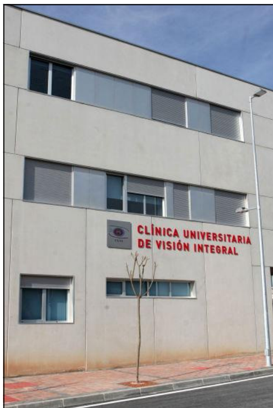
Clínica Universitaria de Visión Integral

Se enviará mayor información sobre el programa y condiciones de inscripción por correo electrónico a todos los colegiados.