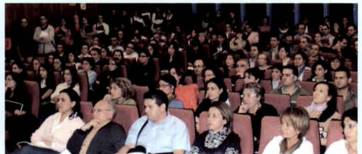
Reunión informativa celebrada en el Salón de Actos de la Consejería de Sanidad. Octubre 2007.