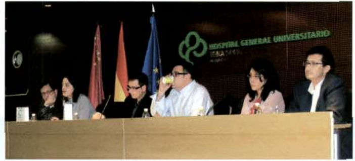
Mesa Redonda. 23 de febrero de 2007.