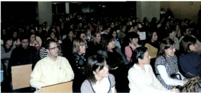
Salón de Actos del Hospital General Universitario Reina Sofía. 23 de febrero de 2007