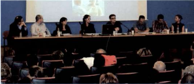
Junta de Gobierno del COORM. Reunión informativa. Octubre 2007.

Más de 220 establecimientos de óptica de la Región solicitaron su adhesión al Plan Regional de Promoción de la Visión en el plazo abierto por la Comisión de Seguimiento del Convenio de Colaboración firmado el 19 de noviembre del año pasado entre el Servicio Murciano de Salud y la Corporación Profesional de Ópticos-Optometristas de la Región, para el desarrollo de actividades de promoción de la visión.