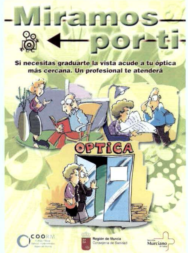
Cartel promocional del Acuerdo de colaboración.

Como se informó, la Consejería de Sanidad ha subvencionado con 30.000 euros la formación de todos los ópticos-optometristas colaboradores.