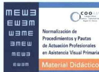
Portada e índice del Libro-Calendario "Material Didáctico".

Por segunda vez en sólo cuatro meses, la Consejería de Sanidad ha cedido sus instalaciones al Colegio Oficial de Ópticos-Optometristas de la Región de Murcia para celebrar reuniones profesionales de gran envergadura en lugares directamente relacionados con la vertiente sanitaria de la profesión.