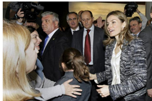
Doña Letizia en la ciudad de Cartagena

El centro, que ha supuesto una inversión de 190 millones de euros del Gobierno regional, cuenta con 667 camas, es pionero en gestión sanitaria y cuenta con la más moderna tecnología.