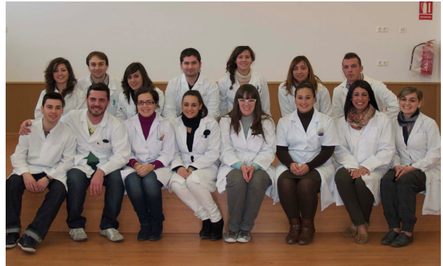
Equipo de Ópticos-Optometristas participantes

Algunos de ellos han aportado su opinión sobre su participación en este tipo de actividades.