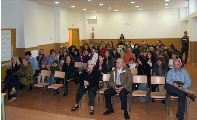
Salón de Actos C.E.I.P. Ntra Sra de Atocha Murcia, 23 de Febrero de 2011